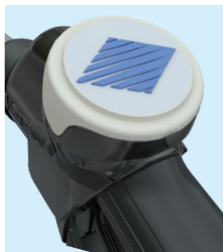
Large platine centrale (47mm) interchangeable pour affichage de message ou publicité. Onglet latéral disponible pour identification du produit

Concernant les références des pistolets et raccords, référez-vous à la brochure