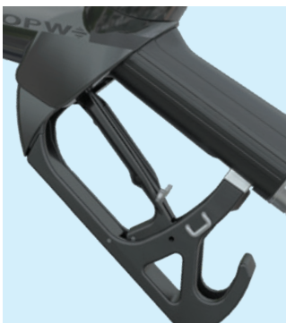
Poignée ergonomique, manipulation aisée du système de blocage